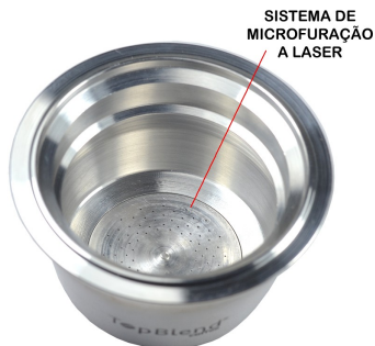
SISTEMA DE MICROFURAÇÃO A LASER

Retire a tampa da cápsula. É possível ver no fundo a área de microfuração à laser, responsável pela extração do café: