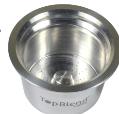
MICROFURAÇÃO A LASER

A peneira de extração fica localizada no fundo da cápsula. A posição correta de encaixe é com o relevo central voltado para cima, conforme na figura ao lado. O pó de café deve ser colocado logo acima desta peneira.