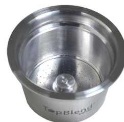
MICROFURAÇÃO A LASER

A cápsula TopBlend possui sistema de filtragem por microfuração à laser que fica no fundo da cápsula, responsável pela extração da bebida.