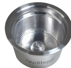
MICROFURAÇÃO A LASER

A cápsula TopBlend possui sistema de filtragem por microfuração à laser que fica no fundo da cápsula, responsável pela extração da bebida.